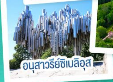
อนุสาวรีย์ซีเบลิอุส

ฟินแลนด์ - เอสโตเนีย - ลัตเวีย - ลิทัวเนีย แวะเที่ยวเซี่ยงไฮ้