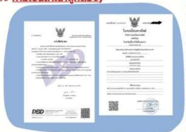
ตัวอย่างหนังสือจดทะเบียนบริษัท และ ใบทะเบียนพาณิชย์