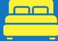
ห้องพักดับเบิล DOUBLE