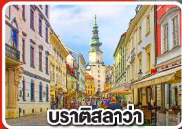
ปราติสลาว่า

เที่ยวเมือง คาร์โลวารี เมืองแห่งสปา พร้อมเมนูพิเศษเปิดโบฮีเมีย