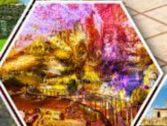
น้ำพอร์บิชิลูส