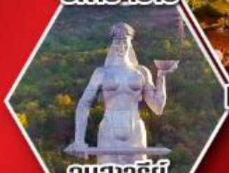
อนุสาวรีย์