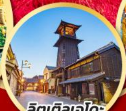
ลิตเติลเอโดะ เมืองควาโกเอะ