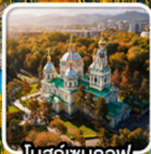
ไบสีก์เซนคอฟ

นั่งกระเช้าคอนโดล่าขึ้นสู่ชิมบูลัก สทึร์สออร์ก ไข่มุกแห่งเทือกเขาเทียนชาน ทะเลสาบโคลโซ หุบเขาเจดี โอกูซ / ภูเขาหินเทพนิยาย / ทะเลสาบอัสซิกกุล ชมการแสดงการล่าเหยื่อของนกออินทรีย์