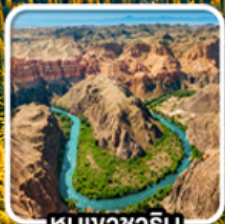
หุบเขาซาริน