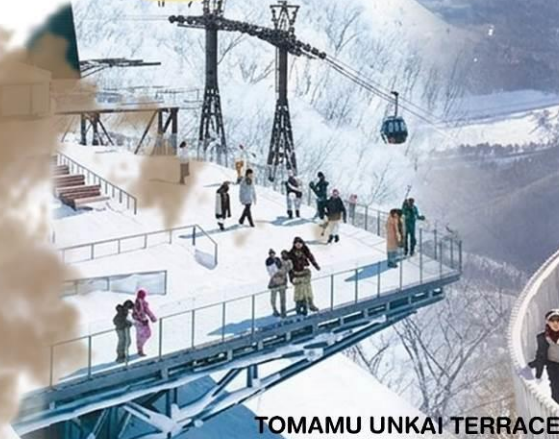
TOMAMU UNKAI TERRACE