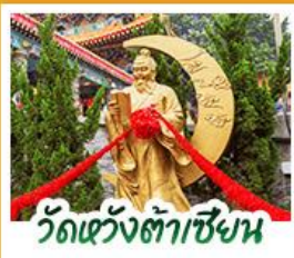
วัดเขangkต้าเซียน