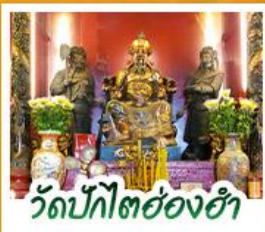
วัดปึกโตย่องฮา