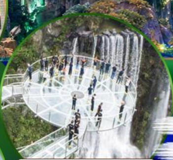
สะพานแก้วคู่หลงเซี่ยะ