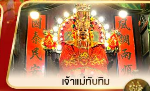
เจ้าแม่ทับทิม