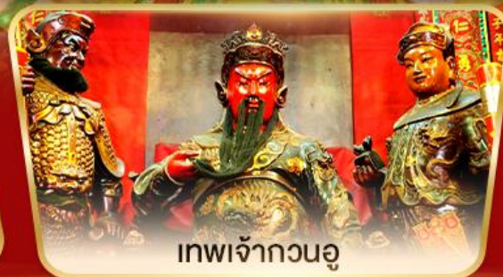
เทพเจ้ากวนอู