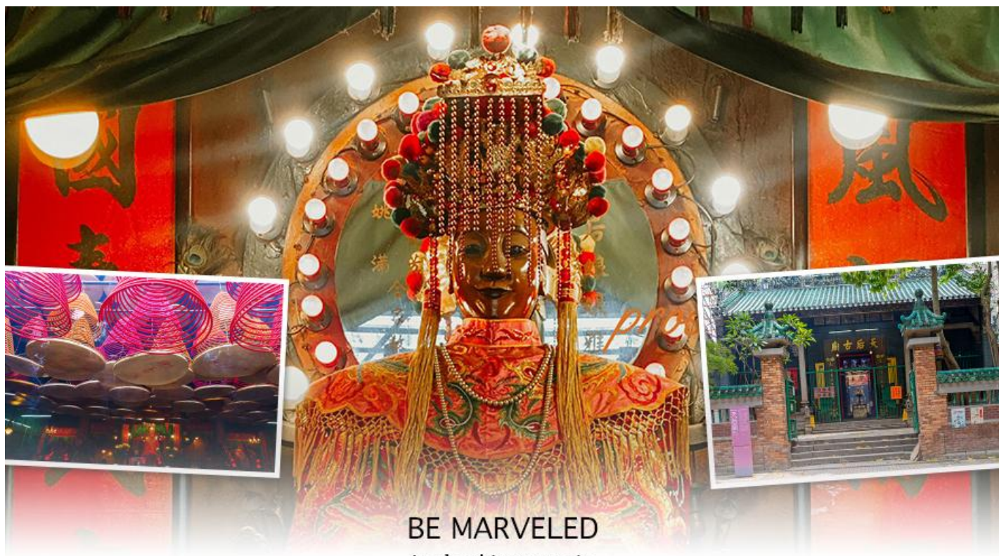
BE MARVELED วัดเจ้าแม่ทับทิมทินฮั่ว

ทองเหลืองอยู่ด้านล่าง นอกจากการมาสักการะบูชาเจ้าแม่ทับทิมในเรื่องของการเดินทางให้ปลอดภัยแล้ว ไฮไลท์สำคัญอีกอย่างหนึ่งของวัดเจ้าแม่ทับทิม ทินฮั่ว (Tin Hau Temple) จะเป็นขดรูปสี่แดงขนาดใหญ่ ที่แขวนอยู่ตามเพดานด้านในวิหารของวัดเต็มไปหมด จะยิ่งสวยงามในยามที่มีแสงแดงส่องลงมาเหมือนเป็นลำแสงส่องทะลุควันรูปแปลกตา ยิ่งนัก ส่วนอาคารของวัดก็จะเป็นสถาปัตยกรรมแบบวัดจีน สร้างขึ้นตั้งแต่ปีค.ศ. 1876 โดยทางเข้าของวัดจะอยู่ติดกับสวนสาธารณะเล็กๆ ที่มีต้นไม้ใหญ่หลายต้น ให้บรรยากาศร่มรื่น