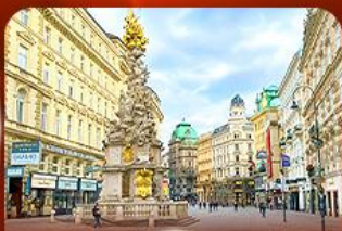
คาร์ทิเนอร์ สตรีท ออสเตรีย