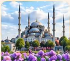
BLUE MOSQUE สุเหร่าสีน้ำเงิน