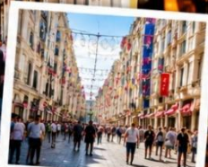
ISTIKLAL STREET (Grand Avenue of Pera) ถนนสายช้อปปิ้ง ยืน 88 ครบรอบในทีเดียว