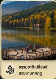
ธรรมชาติเปลี่ยนสี สวยงามทุกฤดู