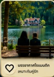
บรรยากาศโรแมนติก เหมาะสำหรับคู่รัก