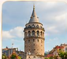
GALATA TOWER หอคอยกาลาตา