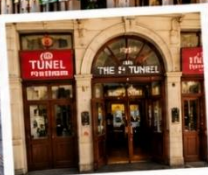
สถานีทูเนล (TUNEL STATION) สถานีรถไฟใต้ดินสายเก่าแก่และเป็นหนึ่งในระบบขนส่งที่เก่าแก่ที่สุดในโลก