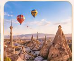
CAPPADOCIA คัปปาโดเกีย