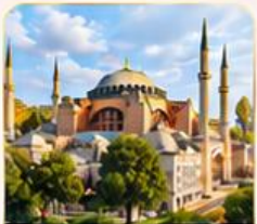
HAGIA SOPHIA โบสถ์เซนต์โซเฟีย