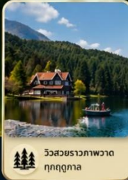
วิวสวยราวภาพวาด ทุกฤดูกาล