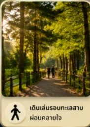
เดินเล่นรอบทะเลสาบ ผ่อนคลายใจ

จุดหมายยอดนิยมของนักท่องเที่ยว สำหรับการพักผ่อนและใกล้ชิดธรรมชาติ