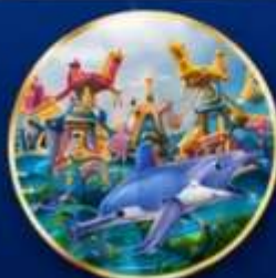
สวนสนุกกลางหลง โอเชียน คิงดอม