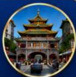
ถนนเปยจิงสู๋ หรือถนนคนเดินปิกกิ้ง