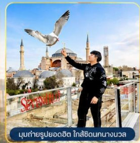
มุขถ่ายรูปรยอดฮิต ใกล้ฮิลตันนางนวล