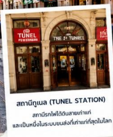
สถานีทูนเนล (TUNEL STATION) สถานีรถไฟใต้ดินสายเก่าแก่ และเป็นหนึ่งในระบบขนส่งที่เก่าแก่ที่สุดในโลก