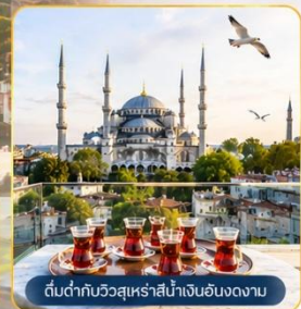
ต้นตากับวิวกุหลาบสีน้ำเงินฮิลตันนางนวล

พิเศษ...สุดๆ! นำท่าน ขึ้นสู่จุดเช็คอินแห่งใหม่ Seven Hills Café ซึ่งเป็นสถานที่ยอดนิยมขณะนี้...บนชั้นดาดฟ้า ของโรงแรมเซเวนฮิลล์ส ท่านจะได้ถ่ายรูปกับวิวมุมต่าง ๆ ช่องแคบบอสฟอรัส, สุเหร่าสีน้ำเงินและสุเหร่าฮาเจียโซเฟีย พร้อม ให้อาหาร กับเหล่าพนักงานนวลที่จะบินมารับอาหารจากท่าน **ขออนุญาตท่านที่ชื่นชมความงามวิวกวไร้อย่าลืม ช่วยอุดหนุนเครื่องดื่ม ชา กาแฟ ซอฟดริงค์ อื่นๆ ตามต้องการ