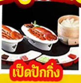
เปิดปิ้งกั๊ง