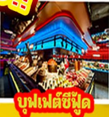
บูฟเฟต์ซีฟู้ด