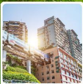
รถไฟกะลุดัก