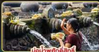
บ่อน้ำพุศักดิ์สิทธิ์