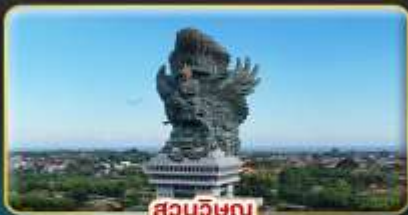
สวนวชิรณู

สัมผัสมนต์เสน่ห์ธรรมชาติ วัฒนธรรม และจิตวิญญาณแห่งเกาะสวรรค์