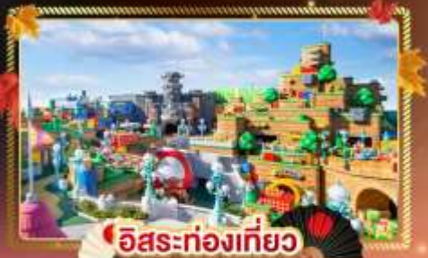
อิสระท่องเที่ยว