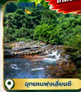
อุทยานฟ่งเลี่ยนซี