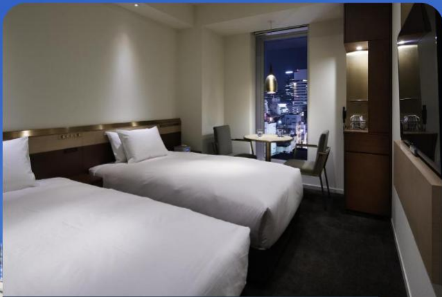
Japanese-style Room 19 sqm

ท่านสามารถเลือกช้อปปิ้งย่านดัง ช้อปปิ้งชินจูกุ ให้ท่านได้เพลิดเพลินกับการจับจ่ายซื้อสินค้านานาชนิด ได้จากที่นี่ ไม่ว่าจะเป็น ร้านชานริโอะ ร้านขายเครื่องอิเล็กทรอนิกส์ กล้องถ่ายรูปดิจิทัล นาฬิกา เครื่องสำอาง ต่างๆ กันที่ร้าน MATSUMOTO แหล่งรวมเหล่าบรรดาเครื่องสำอางมากมาย อาทิ มาร์คเต้าหู้, โฟมล้างหน้า WHIP FOAM ที่ราคาถูกกว่าบ้านเรา 3 เท่า, ครีมนกันแดดซีเซโต้ แอนเนสซ่าที่คนไทยรู้จักเป็นอย่างดี และสินค้าอื่น ๆ หรือให้ท่านได้สนุกกับการเลือกซื้อสินค้า แบรนด์ดัง อาทิ LOUIS VULTTON, UNIQLO, กระเป๋าสุดฮิต BAO BAO ISSEY MIYAKE, เสื้อ COMME DES GARCONS, H&M หรือเลือกซื้อรองเท้า หลากหลายแบรนด์ดัง อาทิ NIKE, CONVERSE, NEW BALANCE, REEBOK ฯลฯ ได้ที่ร้าน ABC MART