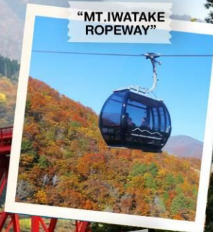
"MT. IWATAKE ROPEWAY"