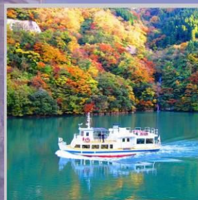
"SHOGAWA YURAN CRUISE"