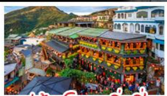
หมู่บ้านโบราณจิ่วเฟิ่น