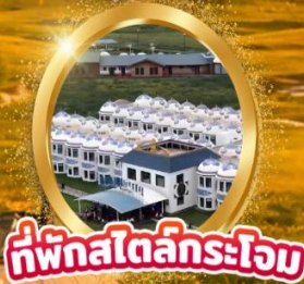
ที่พักสไตล์กระโจม