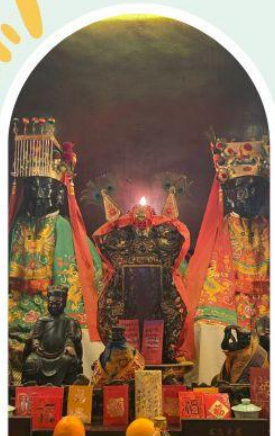
วัดหมิ่นโหมว