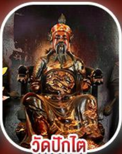
วัดปึกไต้