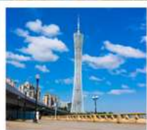
จตุรัสฮิวอิง