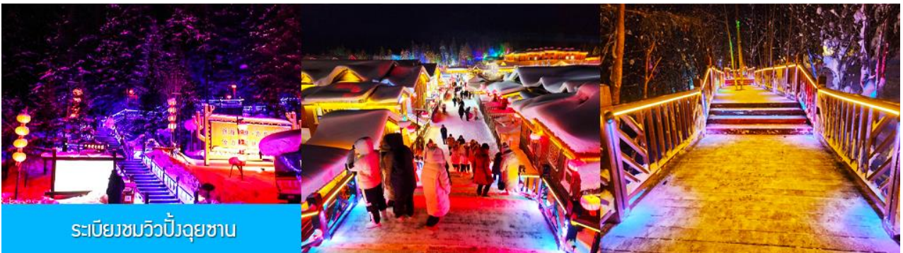
ระเบียบชมวิวยังอุทยาน

เมื่อเดินทางถึงหมู่บ้านหิมะ นำท่านเปลี่ยนมาใช้รถบัสของอุทยานเดินทางเข้าหมู่บ้าน เนื่องจากรถบัสนำเที่ยวจะไม่สามารถเข้าไปในหมู่บ้านได้ นำท่านเช็คอินเข้าที่พักเรียบร้อยแล้ว