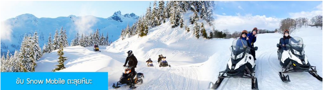
ขับ Snow Mobile ตะลุยหิมะ

ไกด์ท้องถิ่นนำเสนอโปรแกรมเสริม หรือ OPTIONAL TOUR ให้ท่านเลือกตามความสมัครใจ