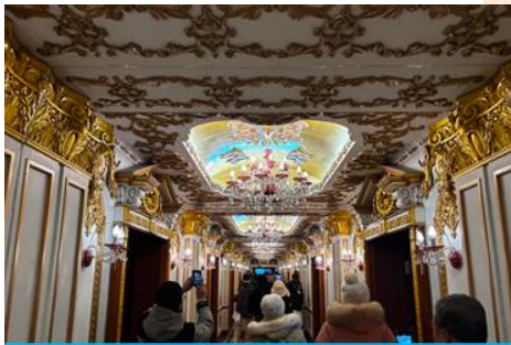
ตึกเภสัชกรรมฮาร์บิน

จากนั้นนำท่านเที่ยวชม ถนนจางยงลู่ 中央大街 ถนนสายหลักของเมืองฮาร์บิน ถนนที่เต็มไปด้วยอาคารบ้านเรือนที่เป็นสถาปัตยกรรมตะวันตกที่สร้างในช่วงคริสต์ศตวรรษที่ 18 – 19 ที่เมืองนี้ถูกปกครองโดยรัสเซีย อีกทั้งเป็นถนนคนเดินที่เป็นแหล่งรวมร้านค้าสินค้าแบรนด์เนมทั้งในและต่างประเทศ ร้านจำหน่ายของที่ระลึกและสินค้าพื้นเมือง ร้านอาหารพื้นเมืองต่าง ๆ มากมาย ให้ท่านมีเวลาอิสระเดินเที่ยวและช้อปปิ้ง หรือลิ้มรสอาหารพื้นเมืองตามอัธยาศัย.. **ให้ท่านลิ้มรสไอศกรีมชื่อดังเก่าแก่ของเมืองฮาร์บินท่านละ 1 ท่านฟรี