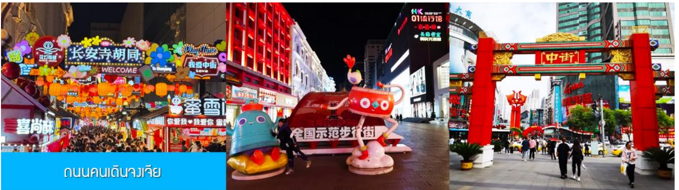
ถนนคนเดินวเวียง