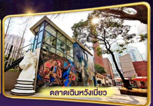
ตลาดเดินห้างเมี่ยว