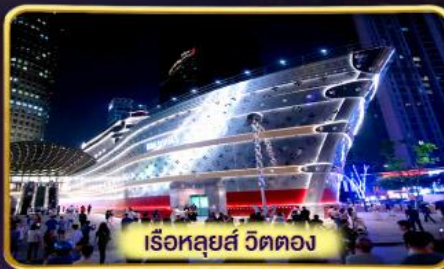
เรือหลุยส์ วิตตอง