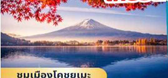
ชมเมืองโคชูยูเมะ