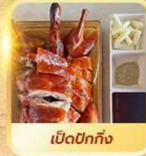
เปิดปีกทั้ง