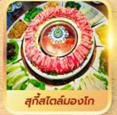
สุกใสโตลมองโก