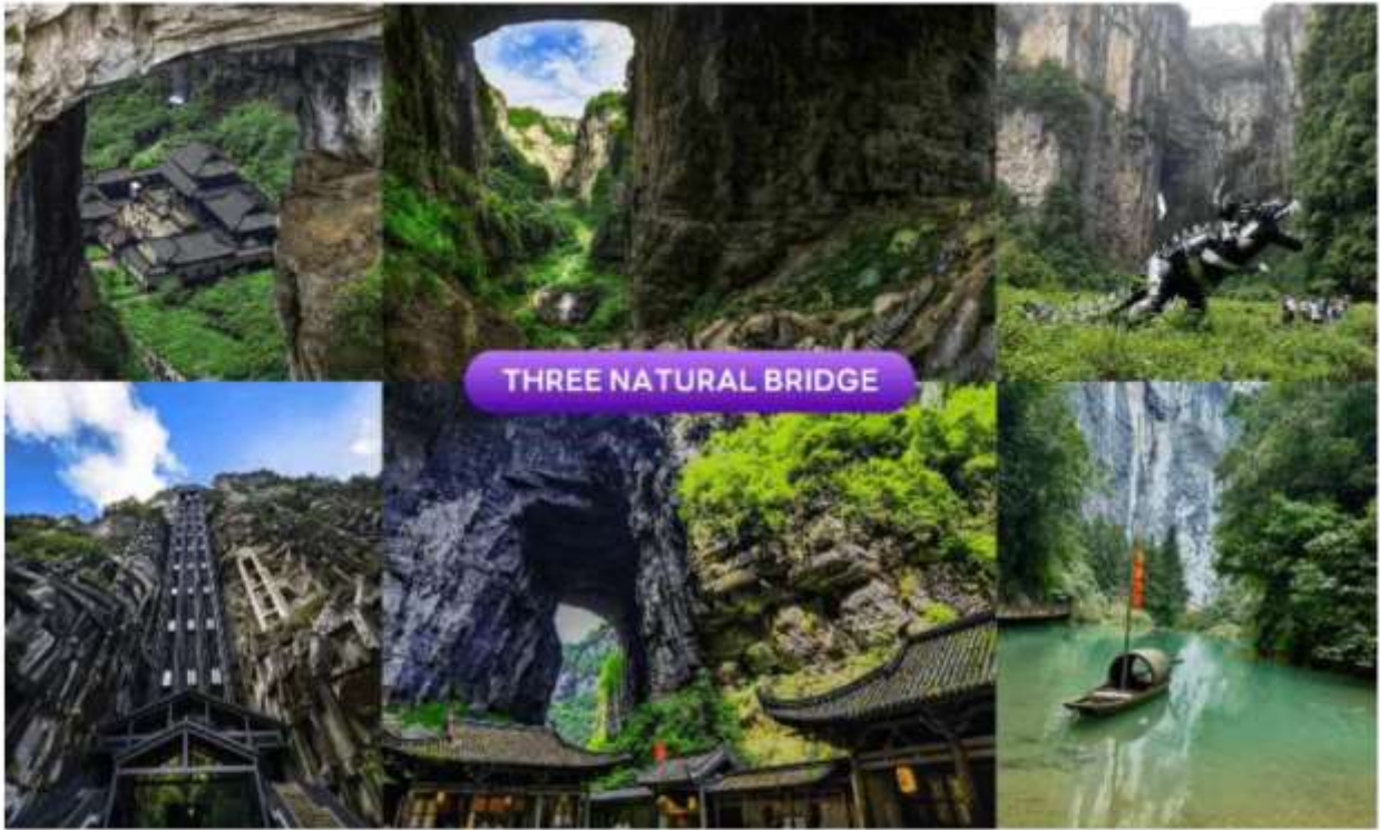
THREE NATURAL BRIDGE