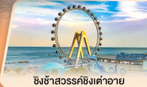
ซิงซ่าสวรรค์ซิงเต่าอาย