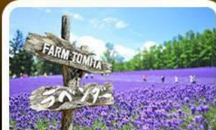
โทมิตะฟาร์ม