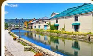
คลองไอตารุ