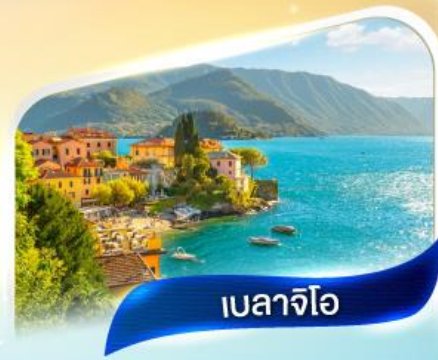
เบลาจีโอ