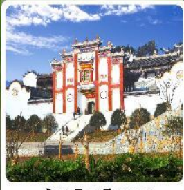
บ้านเกิดชวีหยวน