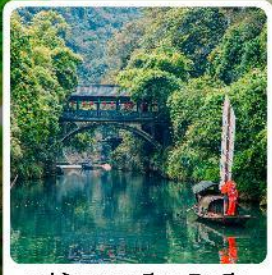
หมู่บ้านซานเสี่ยเหรินเจีย