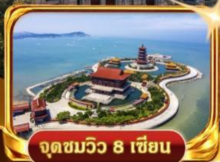
จุดชมวิวกว 8 เซียน