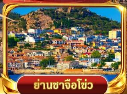
ย่านซาจื่อไซ่