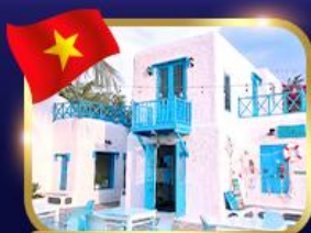
คาเฟ่สไตล์ซานโตรินี่ ชันตรา มารีน่า