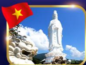
ขอพรองค์กวนอิม วัดหลินอึ้ง