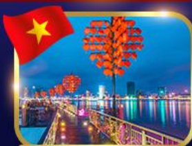
สะพานแห่งความรัก ดานัง