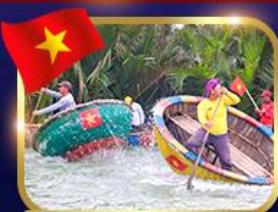
ล่องเรือกระดิว หมู่บ้านกัทนาน