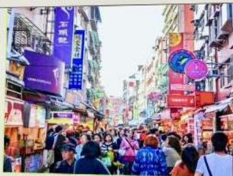
ถนนโบราณตีนส่วย