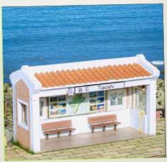
Tiaoshi Bus Station