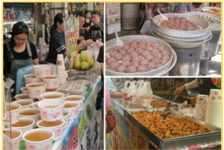
เที่ยง ๑๐ อีสระรับประทานอาหาร ร้านอาหารย่าน ถนนโบราณจินซาน (ไม่รวมค่าอาหาร)