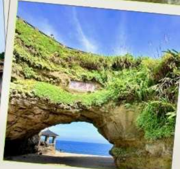
ถ้ำสี่เหมิน