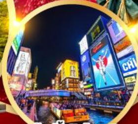
ช้อปปิ้งชินโซบาช