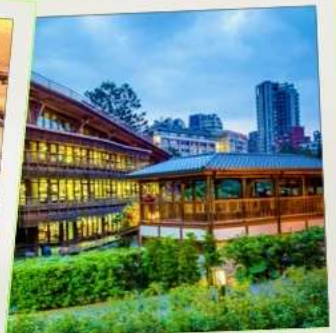
ห้องสมุดเป่ย์โถว