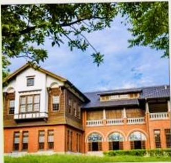
พิพิธภัณฑ์น้ำพุร้อนเป่ย์โถว