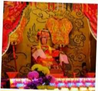
เจ้าแม่ทับทิม จอสเฮ้าส์เบย์