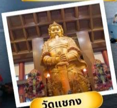
วัดเขากง