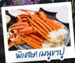
พิเศษ! เมฆงาปู