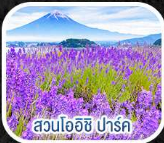
สวนโออิชิ ปาร์ค