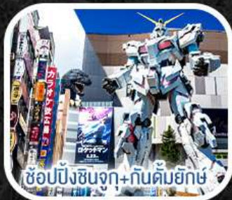
ช้อปปิ้งชินจูกุ+กันดั้มยักษ์