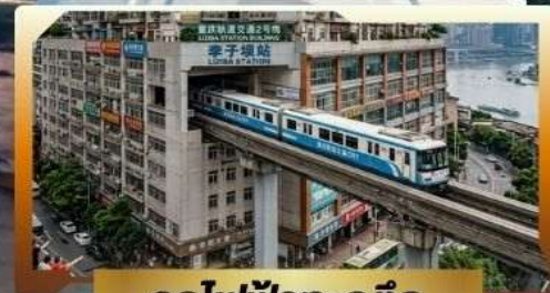
รถไฟฟ้ากะลุดัก