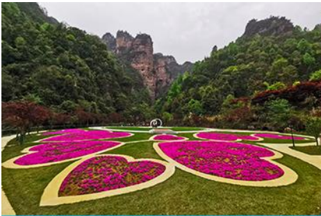
อุทยานฟงเลียนซี