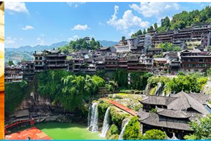
เมืองโบราณผู่หรงเจี๋ย

วันที่สาม เมืองจางเจี๋ยเจี๋ย-ศูนย์แพทย์แผนจีน-ศูนย์จำหน่ายผลิตภัณฑ์ไชชา-ไกด์นำเสนอ OPTIONAL TOUR สะพานกระจกแกรนด์แคนยอน-เมืองโบราณผู่หรงเจี๋ยยามค่ำคืน