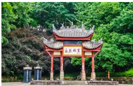
บ้านเกิดกวีซีหยาบ