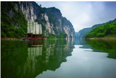
ล่องเรือ เหมาเหยียนเหอ