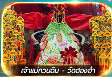
เจ้าแม่กวนอิม - วัดสองอ่า