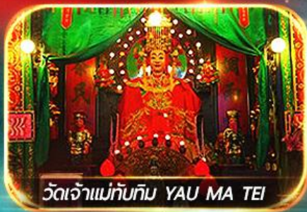
วัดเจ้าแม่ทับทิม YAU MA TEI