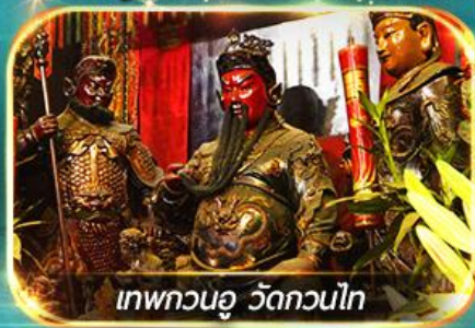
เทพกวนอู วัดกวนไท

พามุไหว้พระ: ขอรพร 8 วัดดัง, อิสระช้อปปิ้ง 1 วันเต็มแบบจุใจ