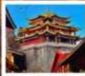
วัดกาม-ซงจ้านหลิง