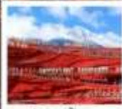
ไร่ชางอีหมว