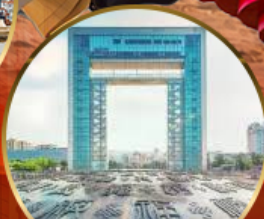
ประตูแห่งความสุข