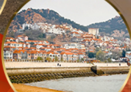
ซาจื่อเป่า