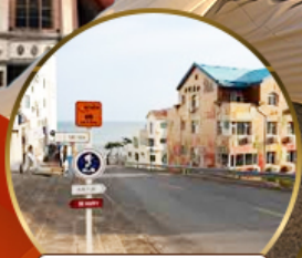
ถนนฮ่าวจี้ปา