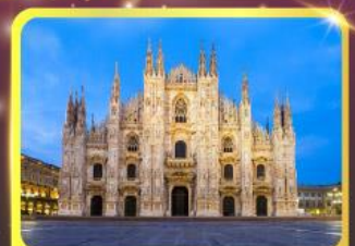
มหาวิหารแห่งเมืองมิลาน