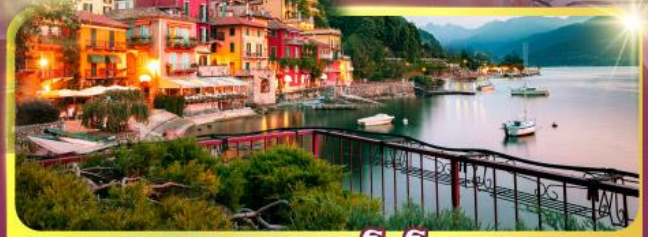
ทะเลสาบโลโบ

11-18 มิ.ย. 69 / 25 มิ.ย. - 02 ก.ค.69 02 - 09, 16-23 ก.ย.69 / 07 -14, 22-29 ต.ค.69 เดินทาง : 04 - 11, 11-18 พ.ย.69 25 พ.ย. - 02 ธ.ค.69 03 - 10, 23-30 ธ.ค.69 / 23 - 30 ธ.ค. 69 29 ธ.ค.69 - 05 ม.ค.70