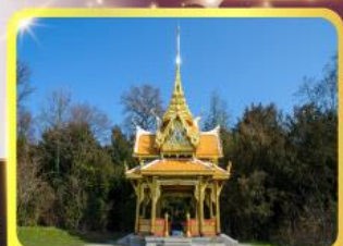
ศาลาไทยไชยาน์

GO3CDG-TG058 • ชมมหาวิหารแห่งเมืองมิลาน 8 วัน | 5 คืน