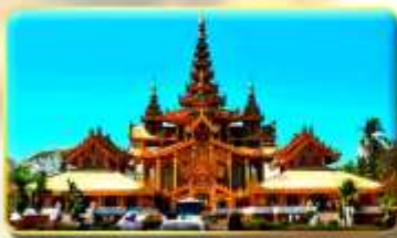
พระราชวังบุเรงนอง