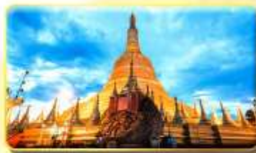
เจดีย์ชเวดากอง