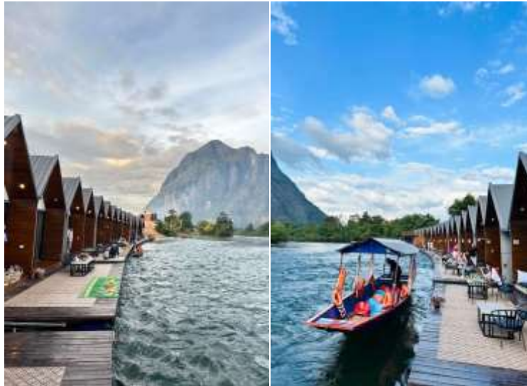
แพที่ แพริวอร์ไซด์ 2 หรือเทียบเท่า

อิสระให้ท่านพักผ่อนชมธรรมชาติตามอัธยาศัย